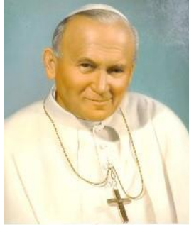
Sv. Jānis Pāvils II 1920 - 2020

„Vertikālā” kopība vieno mūs ar dievišķo noslēpumu un reizē īsteno „horizontālo” vai ekleziālo kopību, kas spēj vienot visus, kas bauda viena galda mielastu mīlestības attiecībās. Pāvils atgādina: „Mēs,