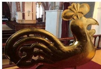
Atjaunotais katedrāles gailis atgriezies torņa smailē 27. maijā