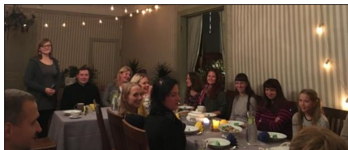
Aglonas svētkelnieku saiets