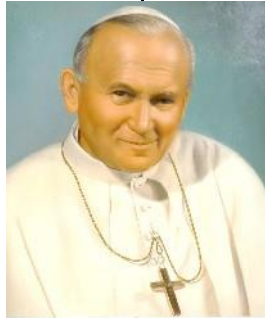
Sv. Jānis Pāvils II 1920 - 2020

Katram būtu pienākums izšķirt un atbildēt Svētā Gara klātienei un darbībai. Svētais Gars ir galvenais misiju darbības veicējs jau no paša sākuma. Svētais Gars