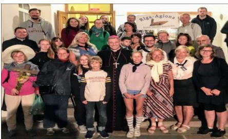
Svētceļnieki Aglonā ar arhibīskapu

Ģimenes pastorālā kalpošanā pāvests aicina uzņemt, pavadīt, izšķirt un integrēt cilvēkus dažādās situācijās, lai atbalstītu tos dzīves ceļā