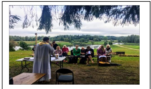
2018.g.svētceļojumā uz Aglonu.

Piemērs: Kādā valstī pilsoņi vēlējuši valdnieku, bet pēc valdīšanas gada to izveduši uz tukšu salu, kur tas miris badā. Viens ievēlētais tomēr uzzinājās par priekšteču likteni un laikus nogādājis uz salu visu vajadzīgo. Arī mēs tikai uz laiku esam šinī pasaulē.