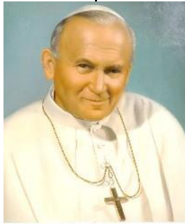
Sv. Jānis Pāvils II 1920 - 2020

Jānis Pāvils II izvērtē Baznīcas sociālās mācības aizsākumus 1891. gada enciklikā „ Rerum Novarum ”, lai to atjaunotu divdesmitā gadsimta otrās puses notikumu ietvaros, īpaši aplūkojot trešajā nodaļā marksisma ideoloģijas iespaids mazināšanos 1989. gadā. Sociālisma piedāvātie risinājumi strādnieku situācijas uzlabošanai izrādījušies neatbilstoši, īpaši no cilvēka cieņas, personīgās atbildības un izvēles viedokļa. Reālais sociālisms nespēja saražot nepieciešamos labumus, pārkāpa cilvēktiesības uz privāto iniciatīvu, īpašumtiesības, kā arī brīvību ekonomiskā jomā. Īstais sociālisma sabrukuma iemesls