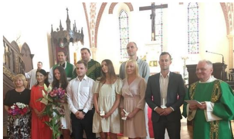
Svētdienas skolas izlaidums 28.jūnijā