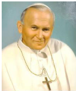
Sv. Jānis Pāvils II 1920 - 2020

Enciklika Slavorum Apostoli izdota 1985. gada 2. jūnijā un veltīta svēto Kirila un Metodija ieguldījumam Eiropas reliģiskajā un kulturālajā vēsturē. Abi brāļi no Tesalonikas bija dedzīgi Evaņģēlija sludinātāji un iestājās par Baznīcas vienotību un vispārīgumu.